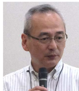
多職種連携のための臨床検査 技師能力開発講習会での会長