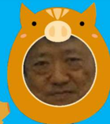
大い(のし)し学会長