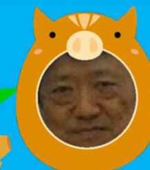
大い(のし)し学会長

大い(のし)し学会長、ありがとうございました。 学会、楽しみですねっ！！今回の会報は号外というこ とで会長新年のごあいさつと皆様ご苦労されているであ ろう法改正の内容で急遽の発行でしたねっ！！