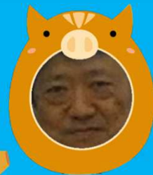
大い(のし)し学会長

和学会まであとわずかですねっ！！ 今回の学会の準備で大変だったこと、ご苦労されたことな どなかったですかー？