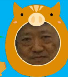
大い(のし)し学会長

今回の学会テーマは「新時代へ」ということで、新しい感覚の学 会を目指して準備してきました。みなさま、ぜひ2月17日は和 歌山JAビルへ足をお運びの上、第39回和歌山県医学検査 学会、御参加のほどよろしくお願いいたします。